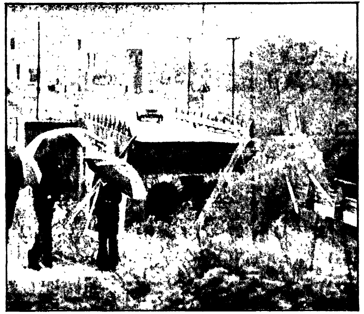
TORINO — Il ponte sul Pellice a Bibiana distrutto dalle acque in piena

Il livello delle acque aumenta di due centimetri e mezzo l'ora